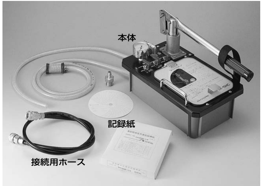
※TR-15HCの記録紙は15分用、TR-60HCは、60分用が付属します。