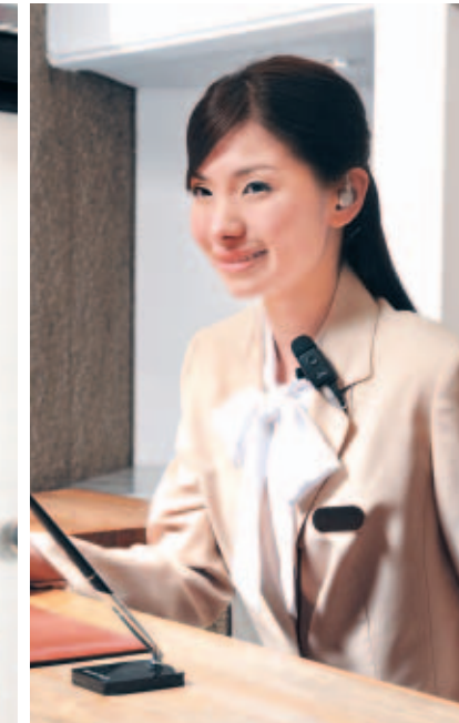
ホテル フロントとベルボーイなどの連携を強化。 効率的で行き届いたサービスを提供できます。