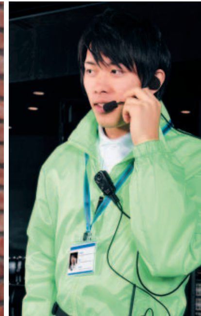
イベント会場 綿密なスタッフ間のコミュニケーションを実現。 円滑なイベント運営や安全確保につながります。