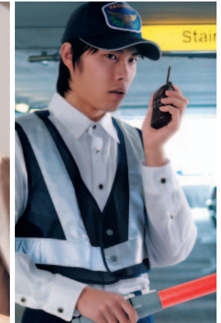
交通整理 交通状況をすばやく、確実に把握。 安全でスムーズな交通整理を実現します。