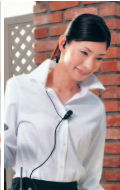
レストラン ホールと厨房などの連絡を効率化。 注文にすばやく応じることができます。