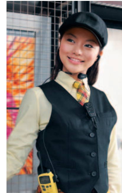
アミューズメント施設 お客様の誘導や、スタッフ間連絡の効率をアップ。 質の高いサービスを実現します。