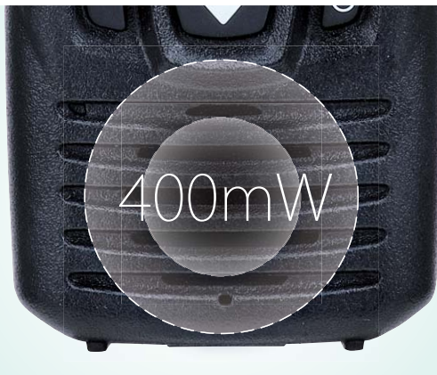
屋外や騒音下でもクリアな音声を伝える 400mW大音量スピーカー