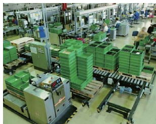
工場での連携・進捗管理