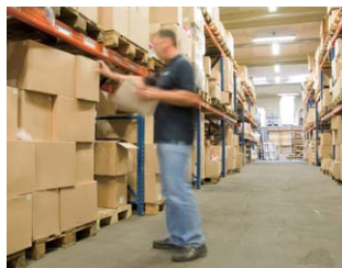
倉庫での配送指示