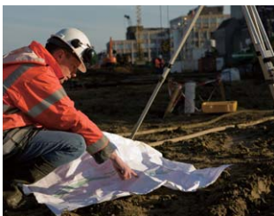
建設・工事現場での業務連絡