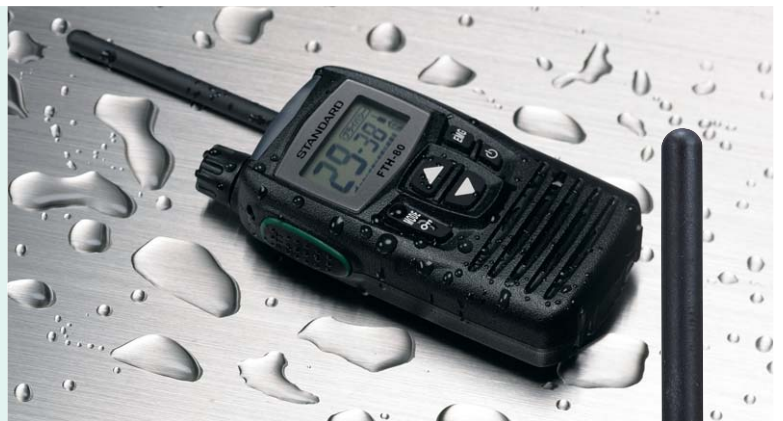
水を扱う現場や突然の雨にも対応する ワンランク上の防水性(IPX5)