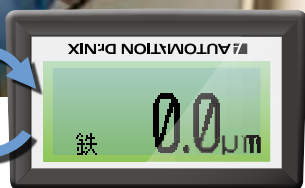
表示反転機能で、画面表示の天地が反転します。