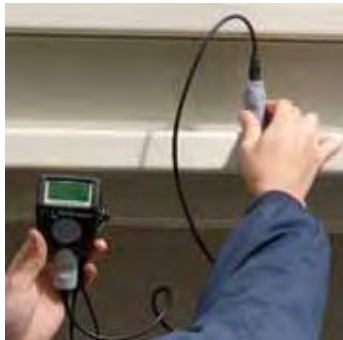
Feプローブとプローブ接続ケーブルでの測定。