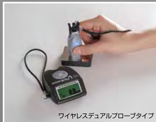
ワイヤレスデュアルプローブタイプ