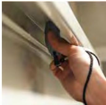
ワイヤレスデュアルプローブでの測定。測定値は無線で本体へ送信されます。

着脱式のプローブと、画面の表示反転機能により、本体の向きや、プローブの向きは一切気にすることなく、さまざまなシーンでの測定が可能となり、測定にストレスを感じません。