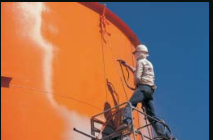
●200Jシリーズは膜厚管理を必要とする多くの現場で使用されています。