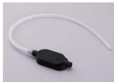
校正用ガスチャンバ CK2-60

●ご使用前に取扱説明書をよくお読みください。 ●性能向上のため、仕様をお断りなく変更することがございます。 ●商品の色は、印刷物のため実際と異なる場合がございます。