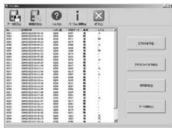
データはパソコンへ保存