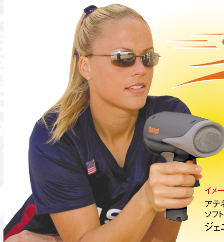
イメージキャラクター アテネ五輪 ソフトボール金メダリスト ジェニー・フィンチ(米国)