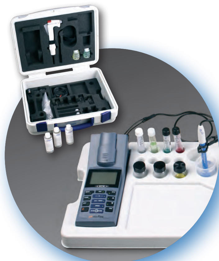
写真はラボトレイに収納された pHotoFlex Turb 型セット

測定に必要な器具が収納できる携帯ケース“Lab tray (ラボトレイ)”-オンサイトの小型実験室です。サンプルリングや測定中にビーカーやセルの転倒を防ぎます。フィールド測定に最適です。