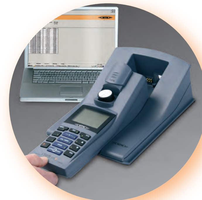
写真はラボステーションと pHotoFlex