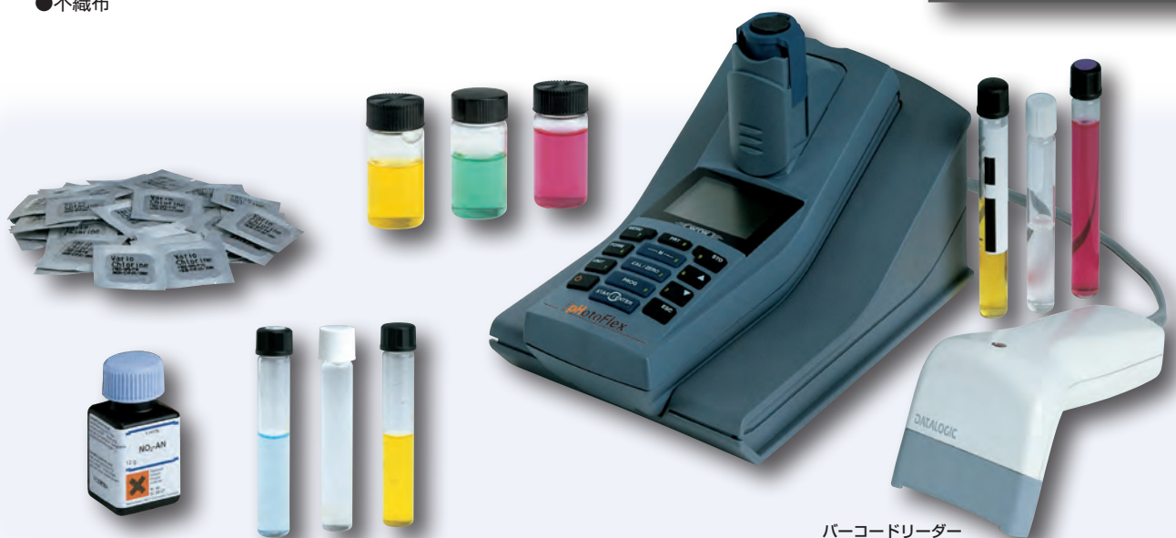
バーコードリーダー