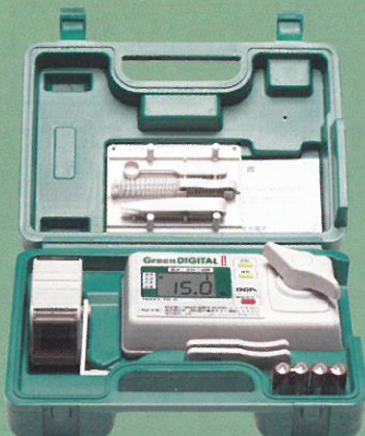
専用キャリングケース