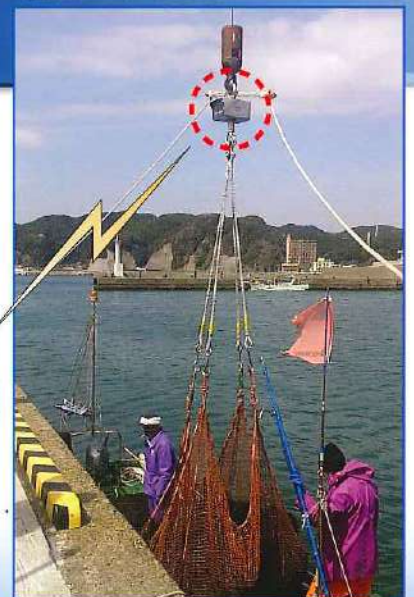
(使用現場：東安房漁協様)