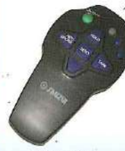
リモコン オプション